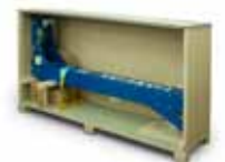
asennettu valmiiksi kuljetuslaatikkoon