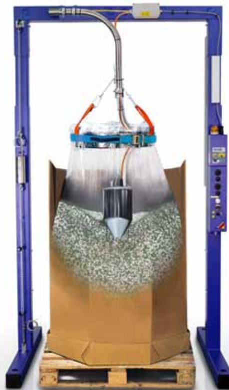
CLASSIC PLUS s voliteľnou výbavou 1

Vyprázdňovanie bez zvyškov bez obsluhy a bez zdvíhania, preklápania alebo otáčania plnej nádoby a s tým spojených problémov.