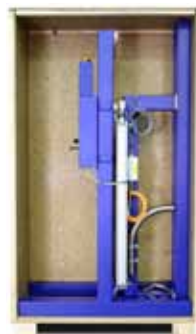
predmontovaná v prepravnej debne