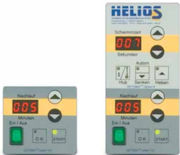
Voliteľná výbava 1/2-riadenie