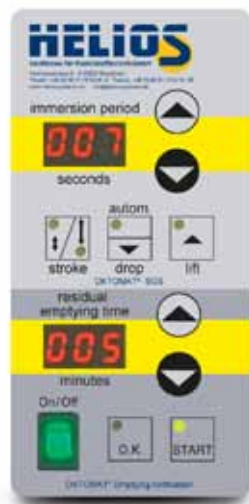
Možnost krmiljenja 1/2/6/9/10