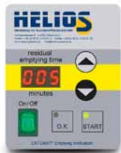
Možnost krmiljenja 1/2